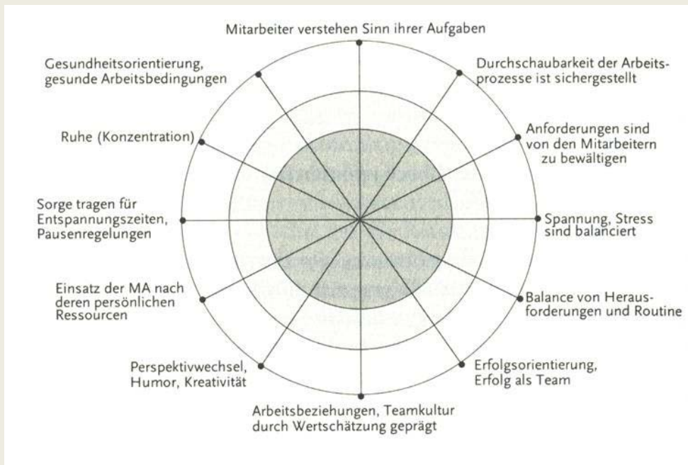
Kreisdiagramm zur Visualisierung der Balancen im Führungsstil (aus Matthias Lauterbach: Gesundheitscoaching, Carl-Auer-Verlag)